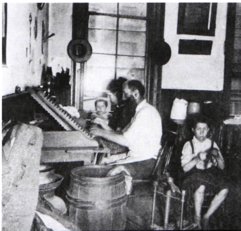
Le travail autonome en 1890.