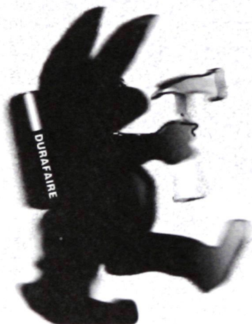
ILLUSTRATION: JAMES WAGNER

* Ex-journaliste et coordonnateur du magazine L'autonome . Remerciements à Tania Gosselin pour sa révision du texte et ses commentaires.