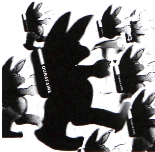
ILLUSTRATION: JAMES WAGNER

...la rumeur veut que les autonomes se multiplient comme des lapins.