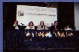
Rencontre internationale des réseaux citoyens à Buenos Aires en décembre 2001.

La 3e Conférence internationale se tiendra à Montréal en octobre 2002. Placée sous le thème Démocratiser la société de l'information : innovations, propositions, actions , l'événement sera modulaire et les activités variées. Les questions abordées lors des conférences précédentes seront approfondies, allant de l'éducation aux arts en passant par la participation civique et l'économie sociale.