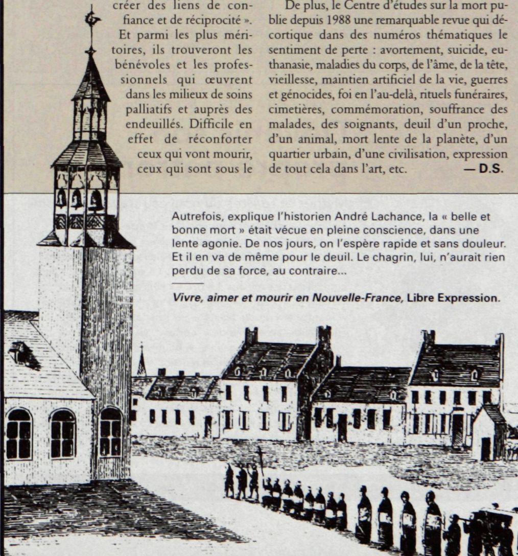
ARCHIVES PUBLIQUES DU CANADA