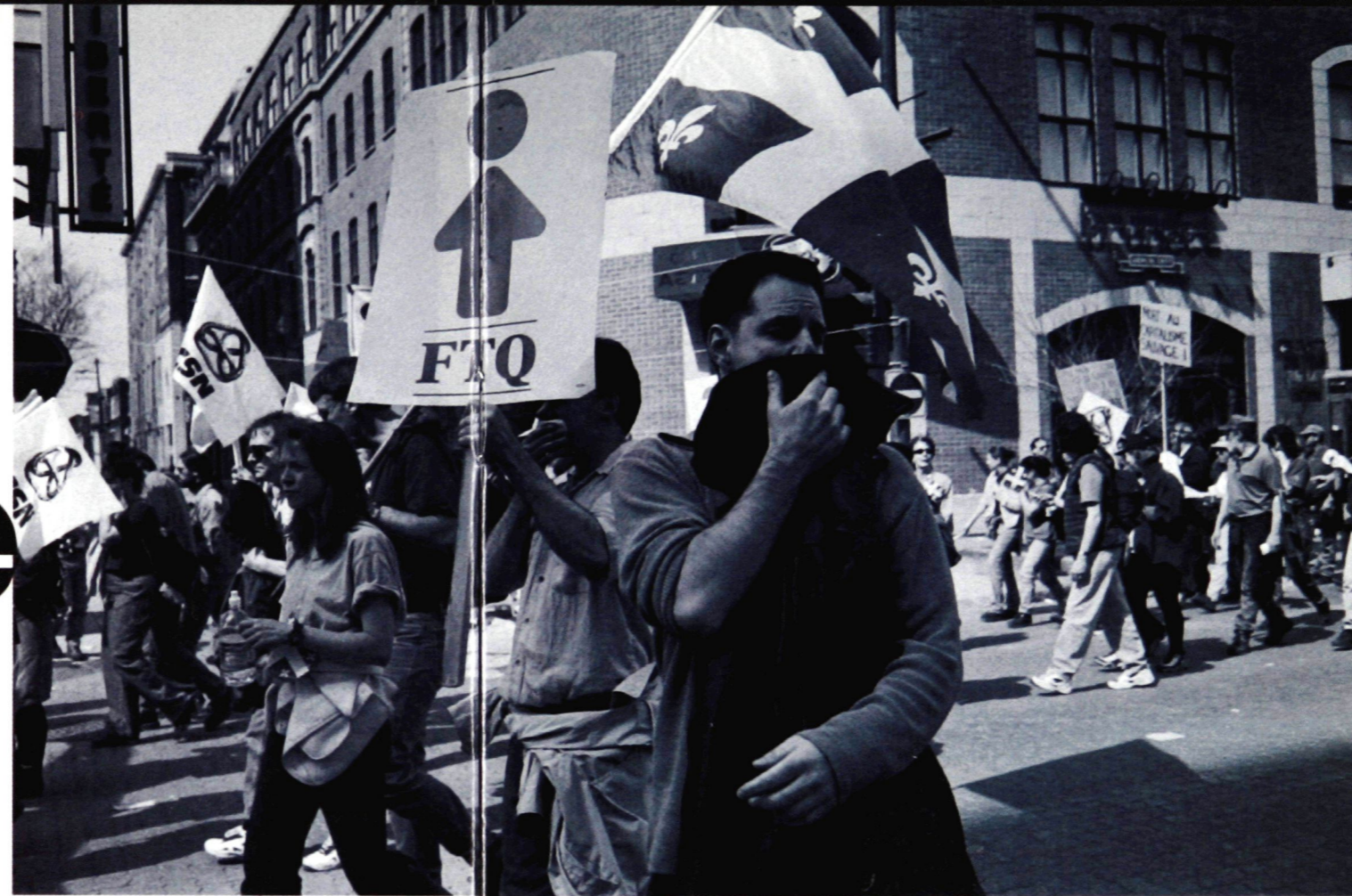
21 avril 2001. Les centrales syndicales organisent la Marche des peuples des Amériques avec des ONG, des écologistes, la Fédération des femmes, le mouvement étudiant et des regroupements de citoyens. Quelque 50 000 personnes défilent dans les gaz, à distance du périmètre de sécurité.