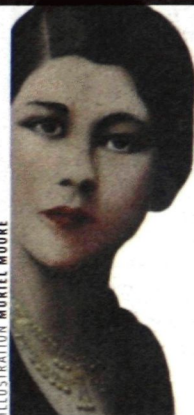
ILLUSTRATION MURIEL MOORE