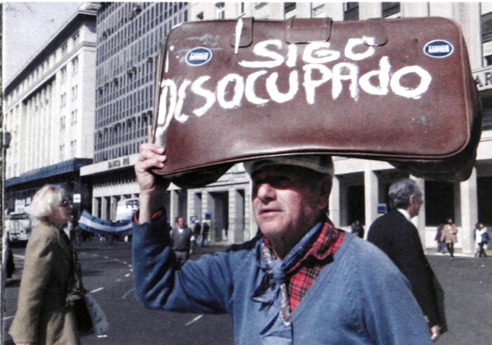
« Je suis encore sans-emploi ! », clame l'inscription sur la valise que ce chômeur argentin portait sur sa tête, durant une vaste manifestation, le 29 août 2001, à Buenos Aires.

chiliennes. C'est un traité pour la libre circulation du capital canadien au Chili. » Caputo dit que les sociétés étrangères, y compris celles du Canada, ne paient même pas la taxe minière exigée habituellement par les États.