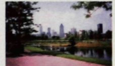
Vue du centre-ville de Montréal du bassin Peel sur le canal.

l'interprétation, offrira aussi une solide formation aux « gens des quartiers limitrophes » qui voudraient devenir guides. Des jeunes du Sud-Ouest, intéressés par la navigation, pourront faire un stage pratique sur le bateau après avoir suivi une formation théorique à l'Institut Maritime du Québec.