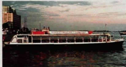
Bateau-mouche de 50 places adapté pour la navigation sur le canal Lachine. Pour réaliser son plan d'affaires et son étude de marché, Production Absolu St-Laurent a notamment reçu l'aide du RISQ et du Programme d'aide technique au développement économique communautaire (PATDÉC).