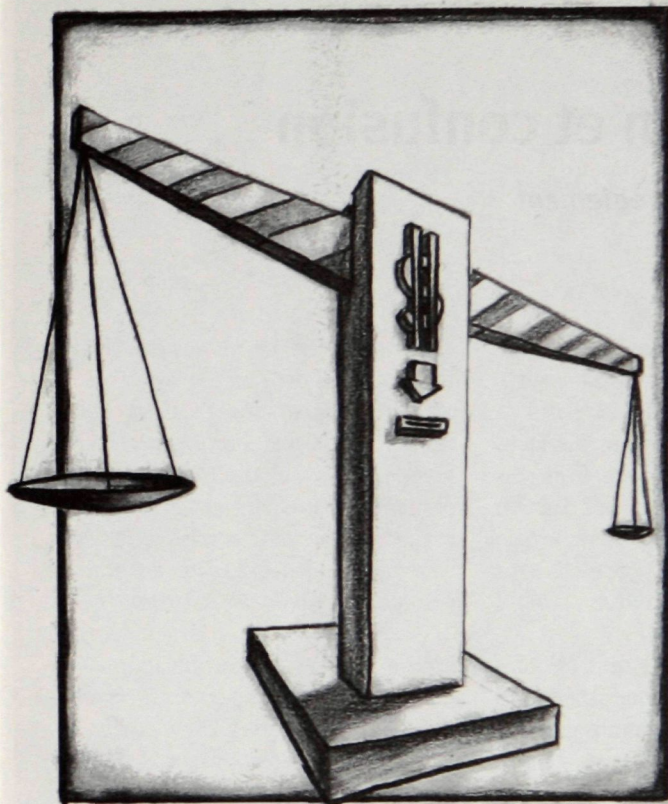
DESSIN : DENIS RIOUX