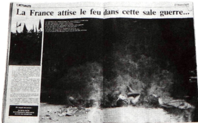
Deux versions d'une photo. En 1982, le magazine de droite Le Figaro publie cette photo recadrée et retouchée, avec la mention «Massacre des Indiens Mosquitos, farouchement anti-castristes, par les Barbudos socialo-marxistes du Nicaragua.» L'originale montrait des employés de la Croix Rouge qui brûlaient, pour l'hygiène, des cadavres des deux factions.