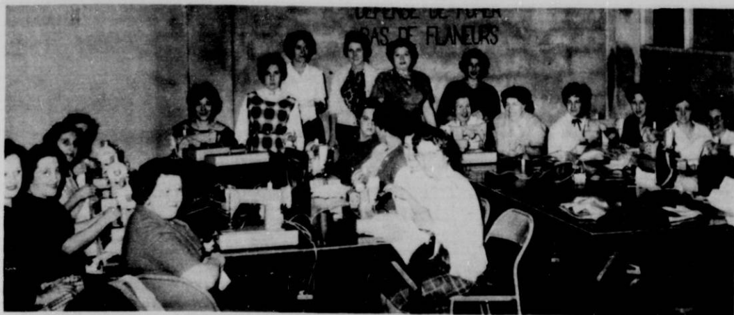
Cours de couture.