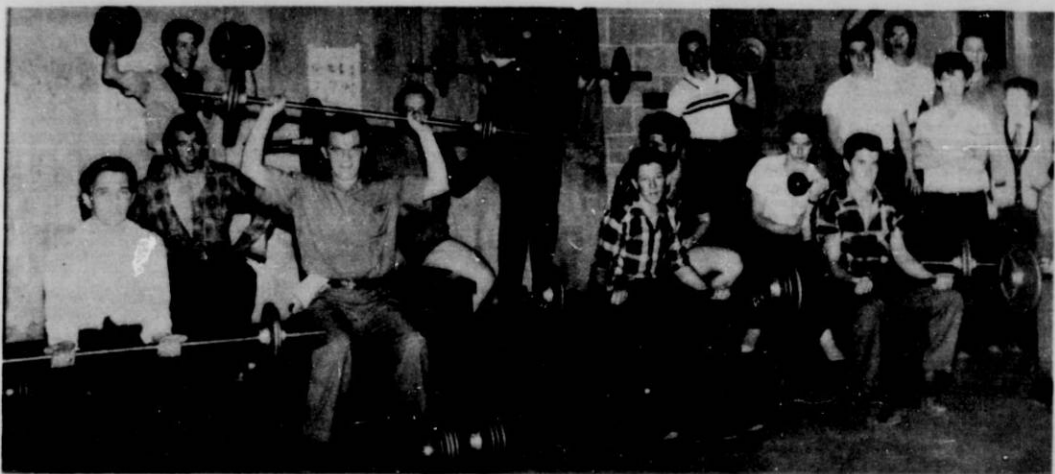
Poids et haltères.