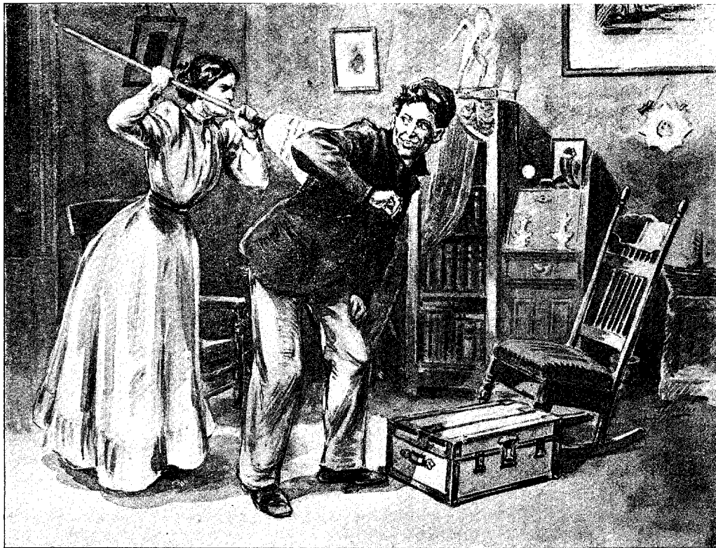
SCÈNE I. — LISETTE ( lui donnant du balai sur les épaules ). Tiens ! puisque t'en veux !... (Page 198.)