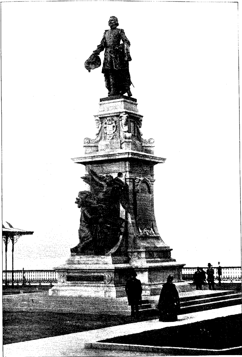
MONUMENT CHAMPLAIN INAUGURÉ À QUÉBEC LE 21 SEPTEMBRE 1898