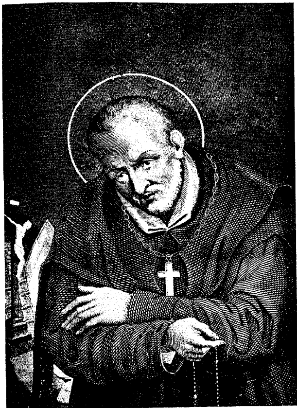
SAINT ALPHONSE DE LIGUORI 1696-1787