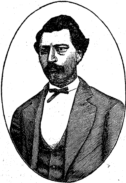
M. LOUIS RIEL.