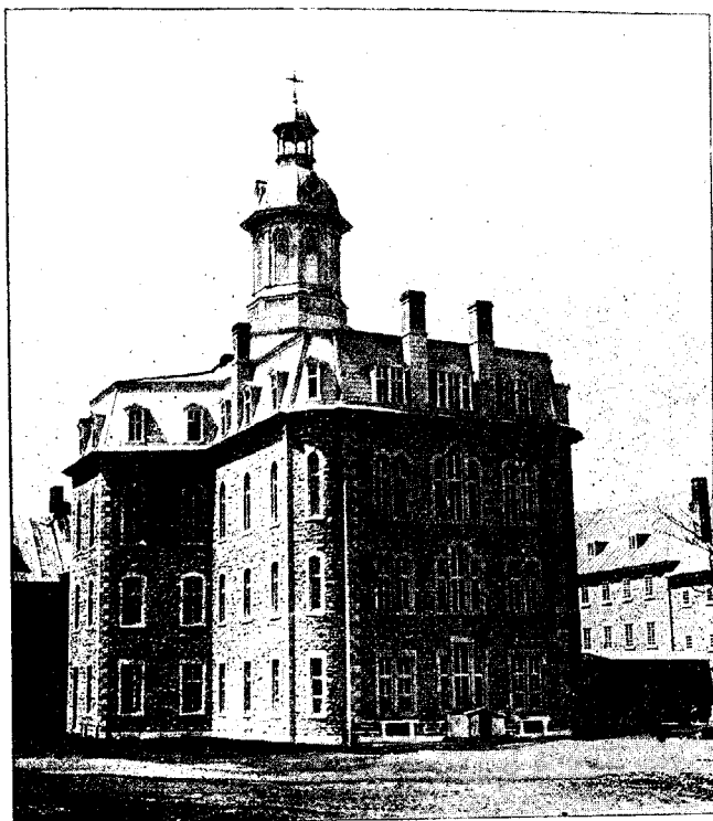
CHAPELLE-MONUMENT DU CENTENAIRE