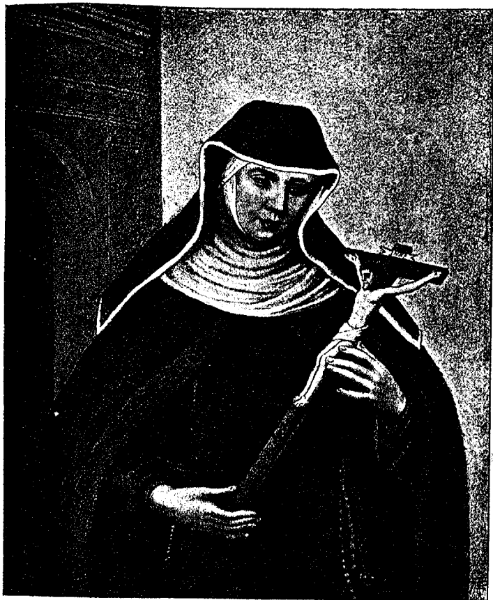
LA VÉNÉRABLE MARIE-CRESCENCE HÖSS.