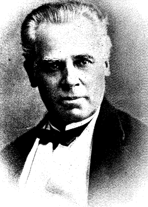
SIR GEORGE-ETIENNE CARTIER.