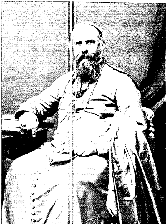
MONSIEUR COMBONI, Vicaire Apostolique de l'Afrique Centrale.