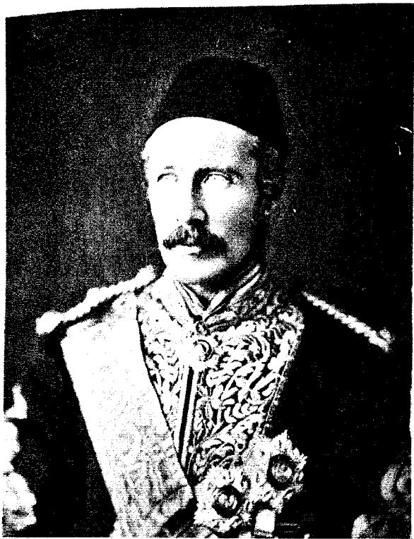
LE GÉNÉRAL GORDON, Gouverneur de Khartoum.