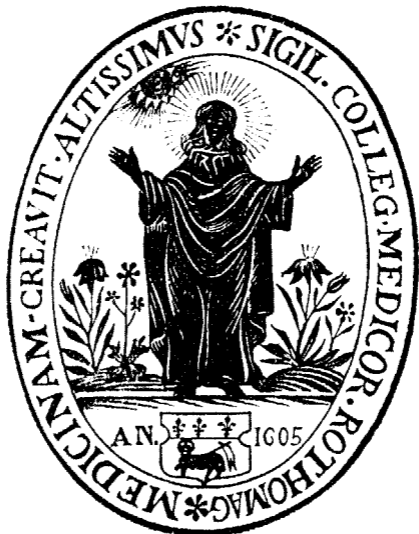
CACHET du Collège des Médecins de Rouen en 1605.