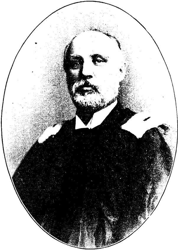
L'HONORABLE THOMAS CHAPAIIS