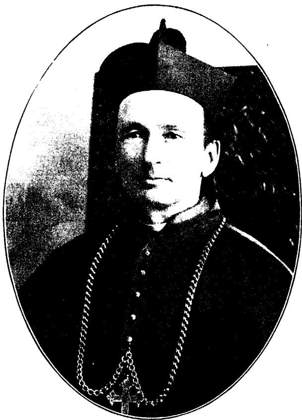
S. G. MGR L.-N. BÉGIN