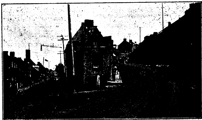
QUÉBEC : CÔTE D'ABRAHAM

La maison habitée par la famille est située dans le quartier de la Côte d'Abraham; elle se compose d'un rez-de-chaussée, surmonté d'un