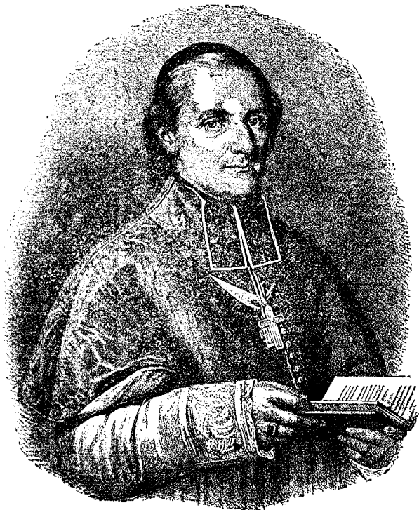
Mgr DE FORBIN-JANSON