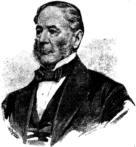
P. A. DE GASPÉ.