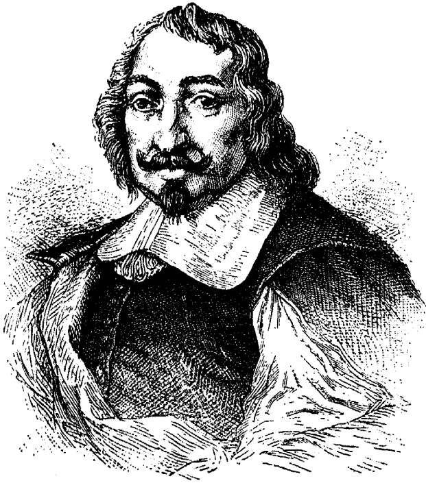
SAMUEL DE CHAMPLAIN