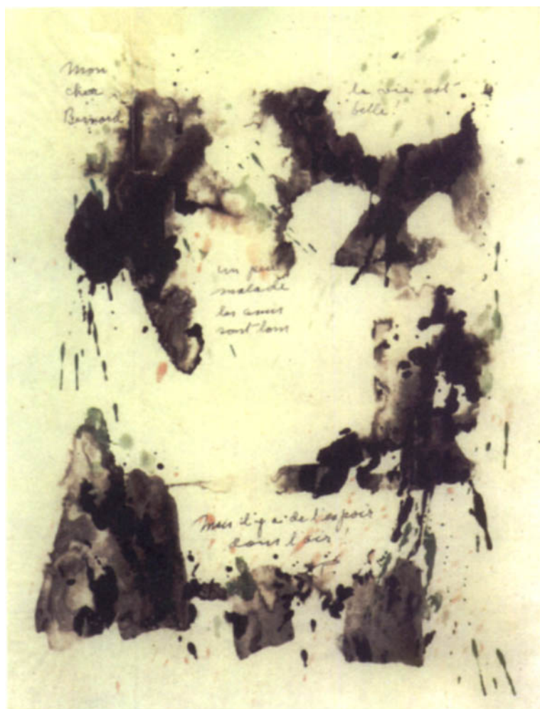
Lettre-décalcomanie à l'encre de couleur sur papier calque, [17 septembre 1959], fonds privé. Voir infra , p. 1071.